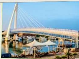
สะพานคู่รักตั้นส่วย