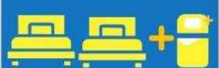
เตียง 3 ท่าน ที่นอนเสริม TRIPLE