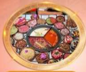
บุฟเฟต์หม้อไฟหลงชิ่ง