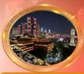
มือตำราอาหารวีวอล์กส์