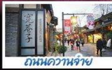
ถนนความจำ