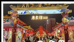
ถนนคนเดินต้าถิง