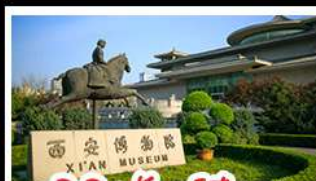
พิพิธภัณฑ์ซีอาน