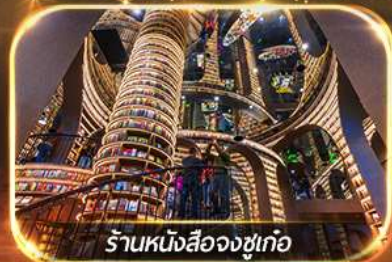
ร้านหนังสือจงซูเท๋อ

เที่ยวชมทัศนียภาพ 2 อุทยาน บีเฟิ่งโกว & ชวงเจียวโกว