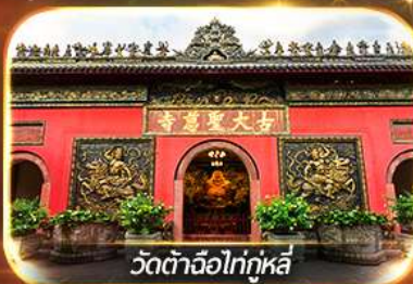
วัดต้าเจี๋ยไท่กุหลี่