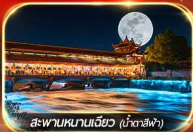
สะพานหนานเจียว (น้ำตาสีฟ้า)