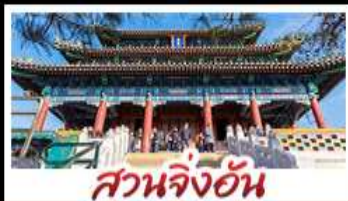
สวนจึงอัน