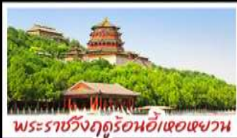
พระราชวังฤดูร้อนอี้เหอหยวน

ท่าแพงเมืองจีนค่ามจวียงกวน - พระราชวังฤดูร้อนอี้เหอหยวน สวนจึงอัน - วัดลามะ - โม่หลงร้านซ้อป - โรงแรม 4 ดาว มือพิเศษ เปิดบิกทิ่ง สุทึนงโถนา MICHELIN GUIDE ร้าน TAO TAO JU