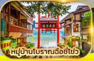
หมู่บ้านโบราณฉือชี่โจว