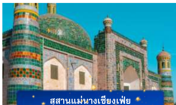
สุสานแม่นางเชียงเพียว

ที่พัก FENGWUQI HOTEL เทียบเท่าหรือระดับ 3 ดาวท้องถิ่น