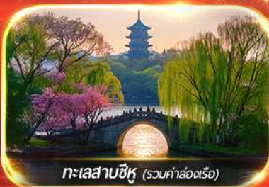
ทะเลสาบซีหู (รวมค่าล่องเรือ)