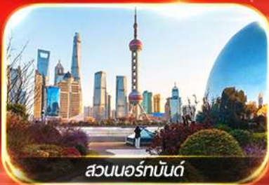
สวนนอร์มันด์