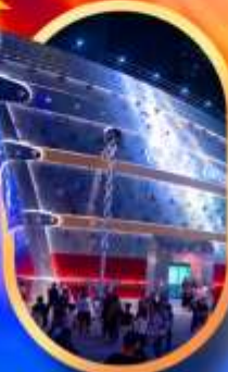
เรือคอะหลุยส์