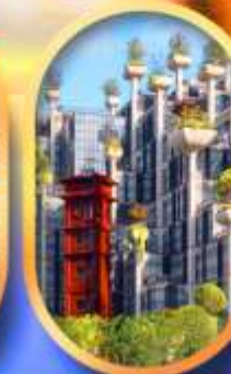
อาคาร 1,000 คัดไม้