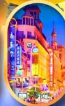
ถนนหนานทิง