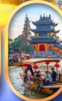
เมืองโบราณจู่เจียเจียว