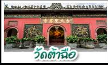
วัดต้าซือ