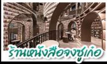
ร้านหนังสือจงซูเก้อ

อุทยานสี่ครุณี - อุทยานน้ำผึ้งโกว - วัดต้าซือ หนีแพนด้านอมเซลฟ์ - ร้านหนังสือจงซูเก้อ ถนนโบราณชอยกว้างชอยแคบ ช้อปปิ้งถนนไท่กู่หลี่ + ถนนชุนซี้ CHENGDU TIMES OUTLETS