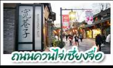
ถนนควนโจ้วเซียงจื่อ