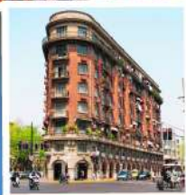
ถนนอู๋คิง