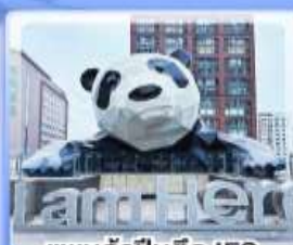
แพนด้าปิ่นตึก IFS