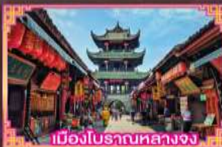
เมืองโบราณหลางจง