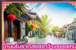
ถนนโบราณซอยกว้างซอยแคบ