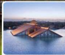
พิพิธภัณฑ์ไดน้ำ กงฟู่หลิน