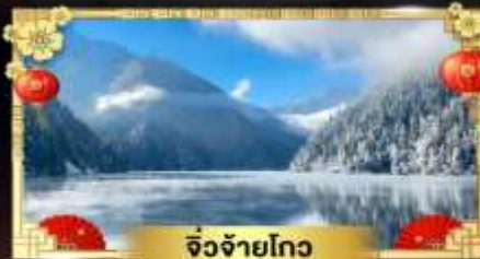
จี๋จ้ายโกว