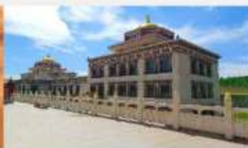
ทำเนียบพระลามะอุหลาน