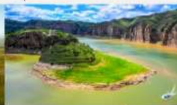
แกรนด์แคนยอนแม่น้ำเหลือง

*ทางบริษัทฯ ขอสงวนสิทธิ์ในการสลับโปรแกรมทัวร์ตามความเหมาะสมขึ้นอยู่กับสถานการณ์ทำงาน โดยคำนึงถึงผลประโยชน์ของลูกค้าเป็นสำคัญ