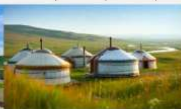
กุ่มหน้าออร์ดอส