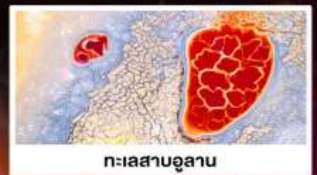
ทะเลสาบอูแลกัน