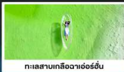
ทะเลสาบเกลือดาเอ๋อร์อัน