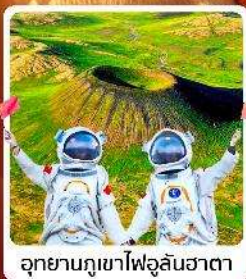
อุทยานภูเขาไฟอูลันฮาตา