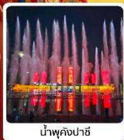
น้ำพุคังปาซี

● ไอลท์ เป็นสายการบินระดับโลก 5A ของจีน ภูเขาไฟอูลันฮาตา น้ำพุคังปาซี น้ำพุที่สูงที่สุดในเอเชีย