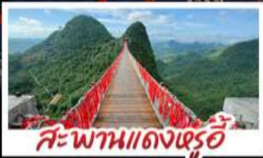
สะพานแดงหรือ