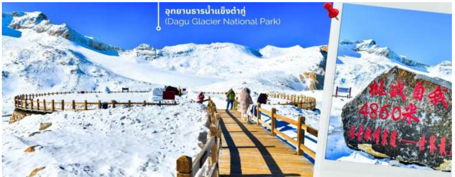
ความหนาวของหิมะขึ้นอยู่กับสภาพอากาศ

จากนั้นนำท่านเดินทางสู่ เมืองเฮยสุ่ย (ใช้เวลาเดินทางประมาณ 2 ชั่วโมง)เพื่อเดินทางไปยัง อุทยานธารน้ำแข็งต้ากู่ (รวมกระเช้าขึ้นลง) ต้ากู่ปิงชว่น หรือ Dagu Glacier National Park เป็นธารน้ำแข็งกลางเขี้ยวที่สวยงามที่สุดแห่งหนึ่งของโลกและเป็นสถานที่ท่องเที่ยวระดับ 4A ของจีน ตั้งอยู่ที่เมืองเฮยสุ่ย ในมณฑลเสฉวน ห่างจากเมืองเฉิงตู ประมาณ 300 กิโลเมตร ถือเป็นธารน้ำแข็งที่อายุน้อยที่สุด ที่ตั้งอยู่ในระดับความสูงที่ต่ำที่สุดและอยู่ใกล้กับเมืองมากที่สุด ในบรรดาธารน้ำแข็งทั้งหมด โดยอยู่สูงจากระดับน้ำทะเลประมาณ 3,800-5,100 เมตร จุดสูงที่สุดที่นักท่องเที่ยวสามารถขึ้นไปได้จะอยู่ที่ 4,860 เมตร