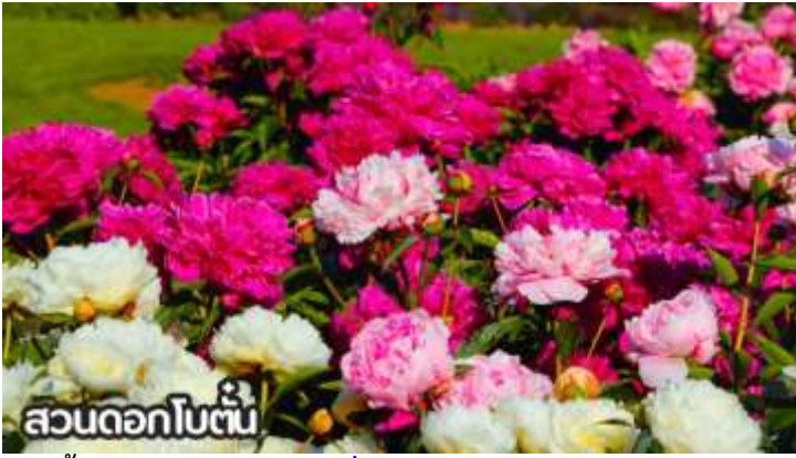
สวนดอกโบตั๋น