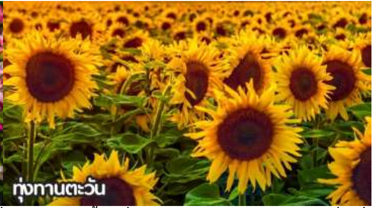
ทุ่งทานตะวัน

จากนั้นนำท่านสู่ ถนนหวังฝูจิ่ง ถนนคนเดินสุดฮิตใจกลางกรุงปักกิ่ง ปัจจุบันถนนนี้เป็นที่นิยมมากในหมู่นักช้อปปิ้งและนักท่องเที่ยวที่ ชอบเข้ามาเพื่อเสาะหาของลดราคาและเสื้อผ้าที่มีเอกลักษณ์ไม่ซ้ำใคร ถนนการค้าที่พลุกพล่านแห่งนี้มีร้าน บาร์ ร้านอาหาร และคาเฟ่เรียงรายตลอดทางอยู่บนถนนคนเดินสายนี้ ให้ท่านได้ช้อปปิ้งร้าน Pop Mart ที่ใหญ่ที่สุดในปักกิ่งตุ๊กตา box หน้าตา น่ารักที่ดังที่สุดในจีนตอนนี้ ต้องยกให้กับ Pop Mart