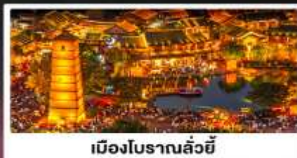
เมืองโบราณลั่วหยี่