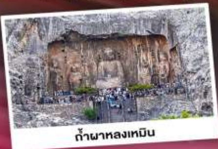
ถ้ำพาลองเหมิน