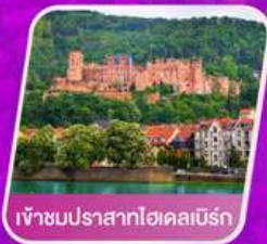
เข้าชมปราสาทไฮเดลเบิร์ก