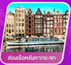
ส่องเรือสิงคารถะจก

เที่ยวเทศกาลดอกไม้เคอเคนฮอฟ ชมแคว้นอาลซัส หมู่บ้านสวยที่สุดในฝรั่งเศส เยือนเมืองมรดกโลก