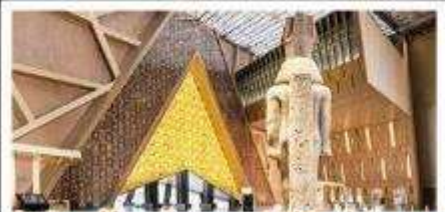
พิพิธภัณฑ์แกรนด์อียิปต์(GEM)

อารยธรรมลุ่มแม่น้ำไนล์ - พีรามิด - อเล็กซานเดรีย - แมมฟิส - ไคโร - โรงแรมระดับ 4 ดาว รวมค่าวีซ่า ตะลุยกะเลทราย - อาหารครบทุกมื้อ