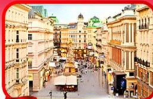
ย่านคาร์กเนออสตรีก