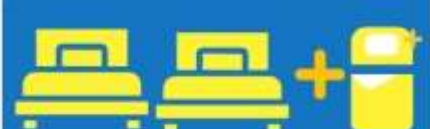
เตียง 3 กาน ที่นอนเสริม TRIPLE