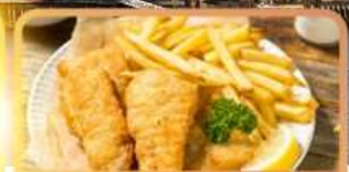
Fish and Chips