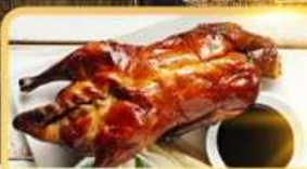
เป็ด Four Season