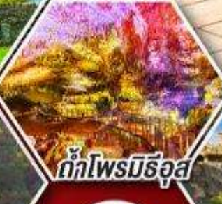
ถ้ำไฟโรบิธอส