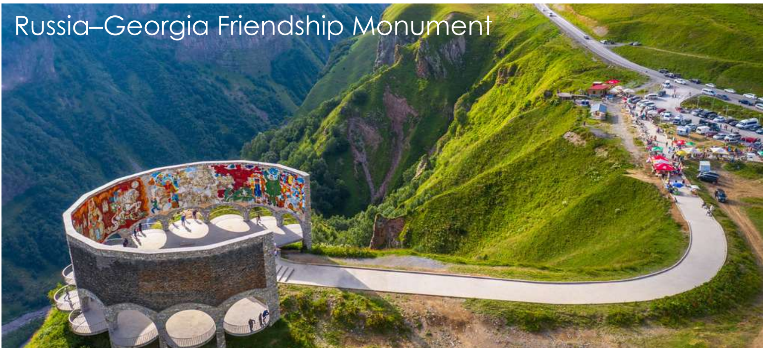
Russia-Georgia Friendship Monument

จากนั้นนำท่านเดินทางสู่เมืองกูตาอูรี (Gudauri) (ประมาณ 50 กม./1ชม.) เมืองสกีรีสอร์ทที่มีชื่อเสียง ตั้งอยู่บริเวณที่ราบเชิงเขาของเทือกเขาคอเคซัส มีความสูงจากระดับน้ำทะเลประมาณ 2,100 เมตร ระหว่างทางชมทิวทัศน์อันสวยงาม ตามทางเส้นทางหลวงที่สำคัญของจอร์เจียที่มีชื่อว่า Georgian Military Highway หรือเส้นทางสำหรับใช้ในด้านการทหาร ถนนสายนี้เป็นถนนสายสำคัญที่สุดที่ถูกสร้างขึ้นในสมัยที่จอร์เจียอยู่ภายใต้การควบคุมจากสหภาพโซเวียต เพื่อใช้เป็นเส้นทางหลักในการข้ามเทือกเขาคอเคซัสจากรัสเซียมายังที่ภูมิภาคนี้ ถนนแห่งประวัติศาสตร์นี้เป็นเส้นทางที่จะนำท่านขึ้นสู่เทือกเขาคอเคซัส(Caucasus Mountain) เป็นเทือกเขาที่ตั้งอยู่ระหว่างทวีปยุโรป และเอเชีย ประกอบด้วย 2 ส่วน คือเทือกเขาคอเคซัสใหญ่ และเทือกเขาคอเคซัสน้อยที่มีความยาวประมาณ 1,100 กม. ที่เป็นเส้นกั้นระหว่างพรมแดนรัสเซียกับจอร์เจีย