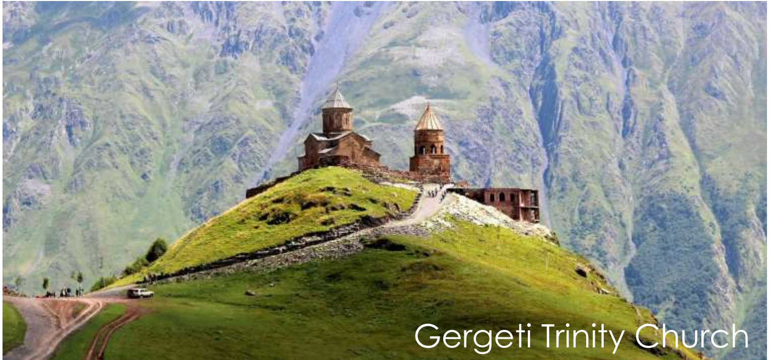
Gergeti Trinity Church

ตั้งอยู่บนเทือกเขาคอเคซัสเบกที่ระดับความสูงจากน้ำทะเล 2,170 เมตร (ในกรณีที่มีหิมะตกหนัก จนไม่สามารถเดินทางได้ ทางบริษัทขอสงวนสิทธิ์ ปรับเปลี่ยนโปรแกรมตามความเหมาะสม)