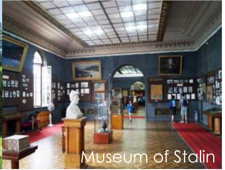
Museum of Stalin

กลางวัน รับประทานอาหารกลางวัน ณ ภัตตาคาร (8)