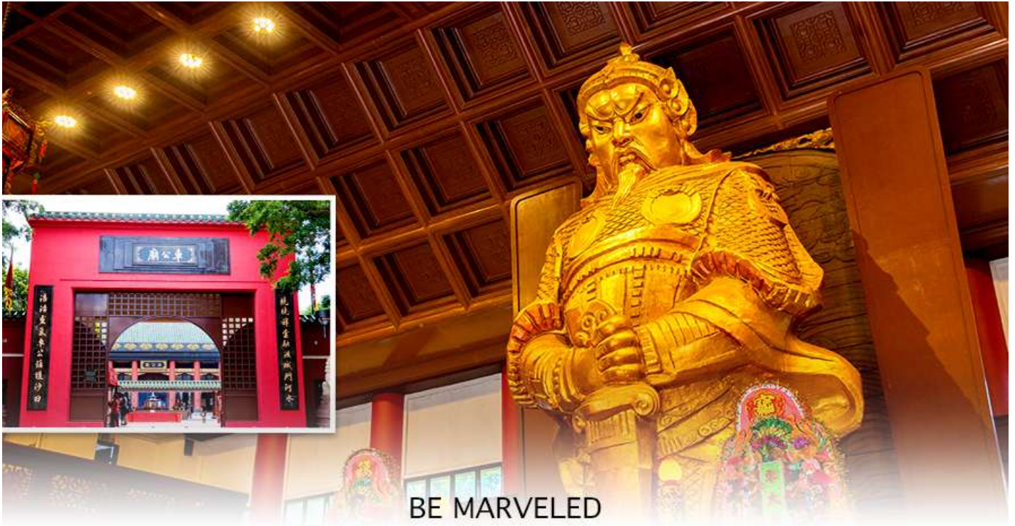
BE MARVELED วัดแขก