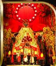
วัดเจ้าแม่กวนอิม สองอำ