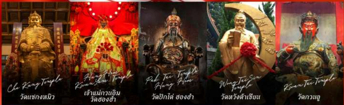
Che Kung Temple วัดแซงกงทมิว

รายการทัวร์ข้างต้นอาจมีการปรับเปลี่ยนเพื่อความเหมาะสม