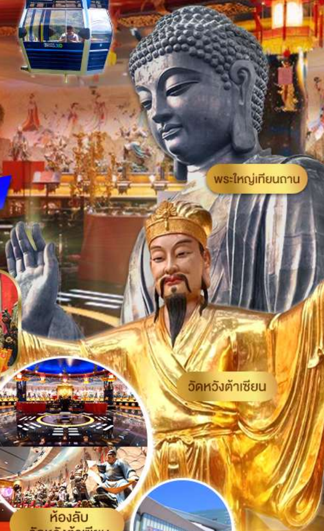
พระใหญ่เทียนถาน