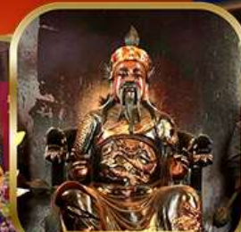
วัดบิกไต้ สองอำ