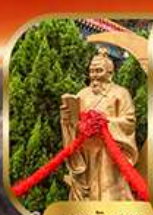
เทพจันตรา

พิเศษฟรี! ลงห้องลับหวังต้าเซียน รวมกระเช้าฮ่องกง