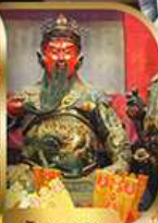
วัดกวนอู