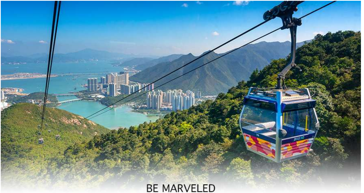
BE MARVELED กระเช้านองปิง

สงวนสิทธิ์ในการเปลี่ยนเป็นใช้รถโค้ชของทางอุทยานในการเดินทาง เพื่อนำท่านขึ้นสู่หมู่บ้านวัฒนธรรมนองปิง บนเกาะ ลันเตาแทน**) จากนั้นนำท่านไปสักการะ (พระใหญ่เกาะลันเตา หรือ พระพุทธรูปเทียนถาน (TIAN TAN BUDDHA STATUE)