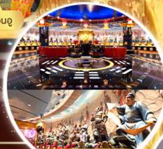
ห้องลับ วัดหวังต้าเซียน