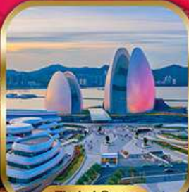
Zhuhai Opera House