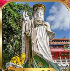
เจ้าแม่กวนอิม พลัสเบย์