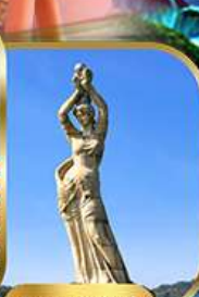
จูไห่ฟิชเชอร์ทรี