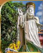
เจ้าแม่กวนอิม ริวฮัสนยี่