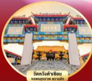
วัดหวังต้าเซียน ขอพรสุขภาพ ความรัก