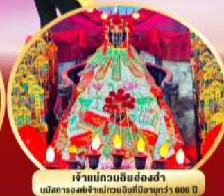
เจ้าแม่กวนอิมย้งฮงฮ่า นมัสการองค์เจ้าแม่กวนอิมที่มีอายุกว่า 600 ปี