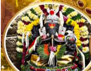
พระตรีศูล ปูणे (Trishul Pune)