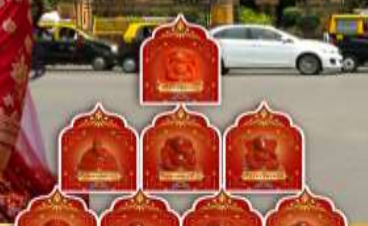
พระพิฆเนศ 8 องค์ เมืองปูणे