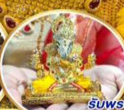
รับพระพิฆเนศวร ปางรำรอย ท่านละ 1 องค์