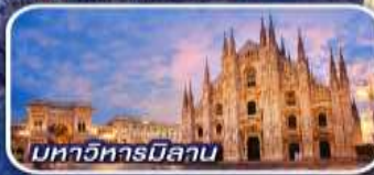
มหาวิหารมิลาน