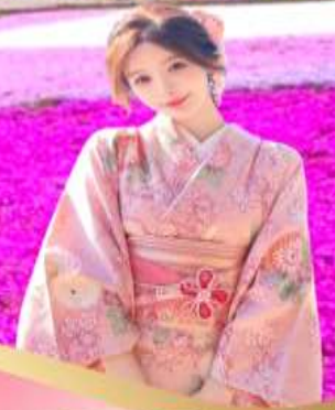
ช้อปปิ้งชินโซบาสึ