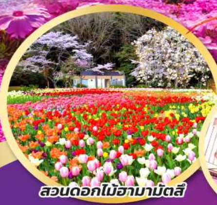
สวนดอกไม้ฮามามัตสึ