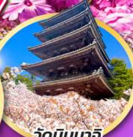
วัดนินนากิ