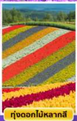
ทุ่งดอกไม้หลากสี