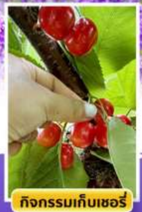
กิจกรรมเก็บเชอร์รี่