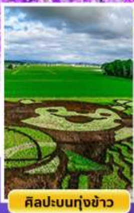
ศิลปะบนทุ่งข้าว