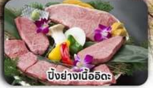
บั้งย่างเนื้ออิดะ