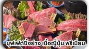
บุฟเฟ่ต์บั้งย่าง เนื้อญี่ปุ่น พรีเมียม