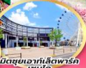
มิตซูเอากะเล็ดพาร์ค เซนได

จุดชมซากุระเริ่มต้น ฮิโตะเมะ เซ็มบง ซากุระ เริ่มต้น