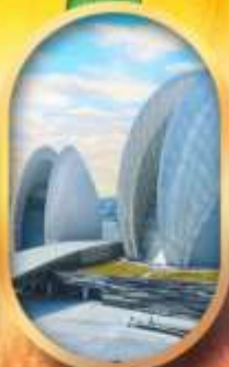
โรงละครไข่มุก