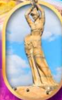
เด็กหญิงชาวประมง