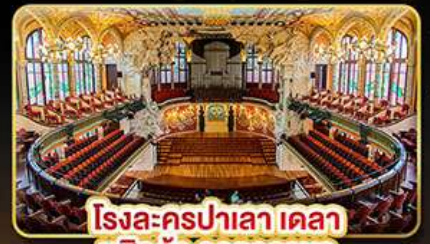
โรงละครปาลาเลา เดลา มุสิก้า คาคาลานา