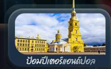
ป้อมปีเตอร์แอนด์ปอล