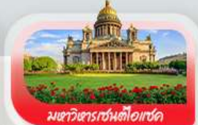
มหาวิหารเซนต์ไอแซค