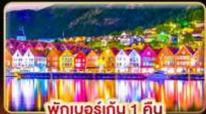
พักเบอร์เกน 1 คืน