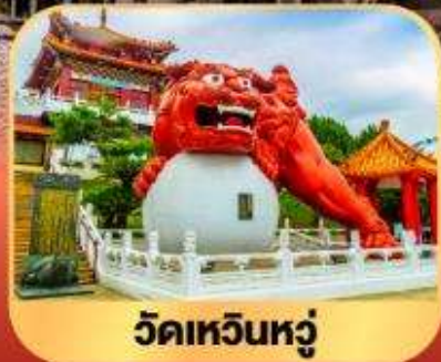
วัดเหวินหลู่