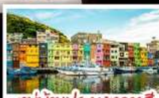
หมู่บ้านประมงหลากสี