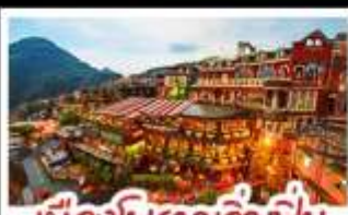
เมืองโบราณจิวเฟิ่น

ฟาร์มแกะซิงจิ้ง - ทะเลสาบสวี่นจินตรา จิวเฟิ่น - หมู่บ้านประมงหลากสี - ไทเป 101 หมู่บ้านสายรุ้ง - ตลาดล่าหู่ & ซีเหมินติง ปลาประ-ธานธิบตี - เขียวหลงเป่า